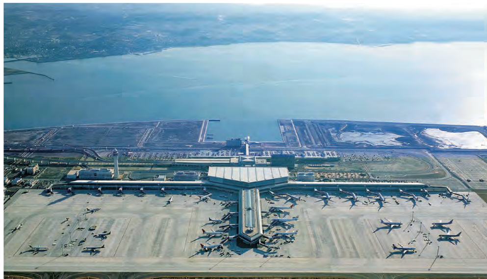
中部国際空港（愛知県）

代替物としてではなく、その優れた特性を活かした付加価値の高い工業製品として、より一層の品質向上、利用技術の開発、製品の安定供給に努めてきた。鉄鋼スラグは、こうして100年にわたり培ってきた技術と信頼によって、セメント用材や道路用材、土木工事、港湾工事用材、コンクリート用骨材など幅広い用途に使用されるようになり、社会基盤充実の一翼を担っている。さらに、全鉄鋼スラグ生成量の99%が資源化された現在でも、社会環境の変化に対応すべく新たな利用技術開発や製造技術の改善に邁進している。