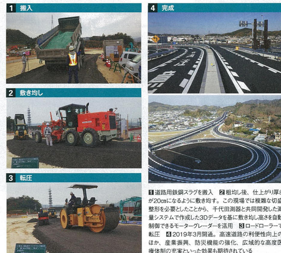
1 搬入 2 敷き均し 3 転圧 4 完成 道路用鉄鋼スラグを搬入 2 粗均し後、仕上がり厚さが20cmになるように敷き均す。この現場では複雑な切盛整形を必要としたことから、千代田測器と共同開発した測量システムで作成した3Dデータを基に敷き均し高さを自動制御できるモーターグレーダーを活用 3 ロードローラーで転圧 4 2019年3月開通。高速道路の利便性向上のほか、産業振興、防災機能の強化、広域的な高度医療体制の充実といった効果も期待されている