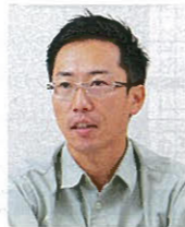
大成ロテック株式会社 関西支社 神戸事業所 神戸工事事務所 係長(工事担当)

鉄鋼スラグ製品は、高速道路インターチェンジ舗装の路盤材としても活用されている。現場は、西日本高速道路(NEXCO西日本)が発注する阪和自動車道 和歌山南スマートインターチェンジ舗装工事。下層路盤材として、調達面や性能面の理由から、設計段階で道路用鉄鋼スラグを用いることが織り込まれていた。施工者である大成ロテックによれば、道路用鉄鋼スラグの活用には、施工段階でもさまざまなメリットがあるという。