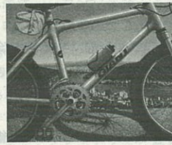
第16回尾道賞(グランプリ)「小休止」(土肥健次)