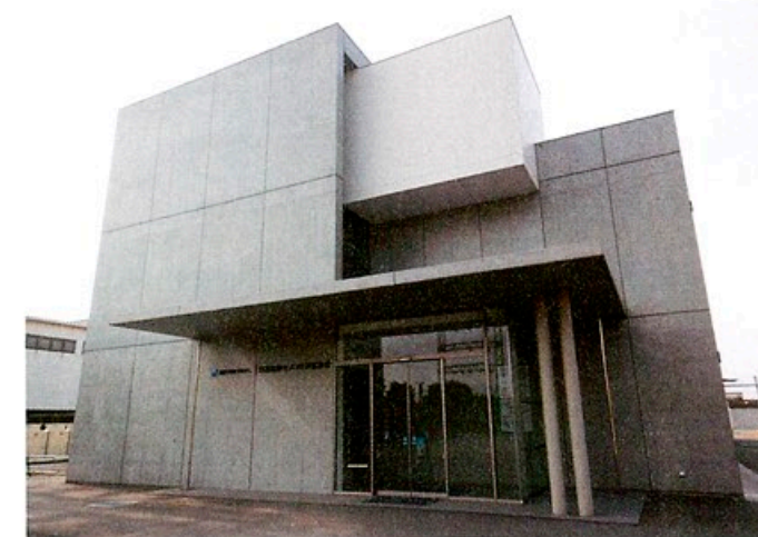
外観はRC造らしい打ち放しの仕上げとし、素材の力強さを感じさせるデザインに(写真左)。室内でポイントとなったのは、2階の執務室だ。約18mものスパンで構成される大空間では、上階の床を支えている梁をそのまま打ち放しで表すことによって、室内側にもコンクリートらしい質感が伝わってくる(写真下)

今回の本社建て替え工事のテーマとなったのは、同社の主力商品である高炉セメント、ECMセメントを「主役」